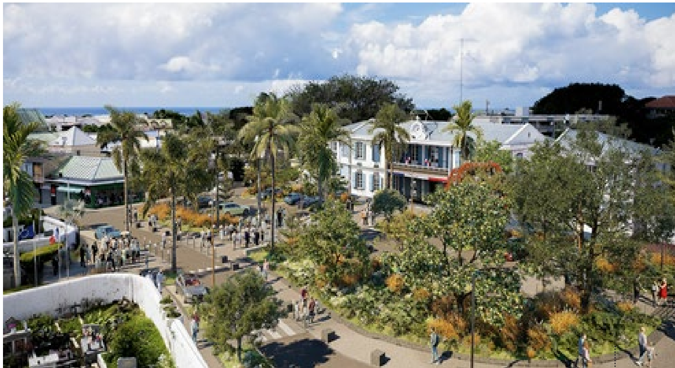
3) La nouvelle place de la Mairie Moderne et végétalisée avec du mobilier urbain