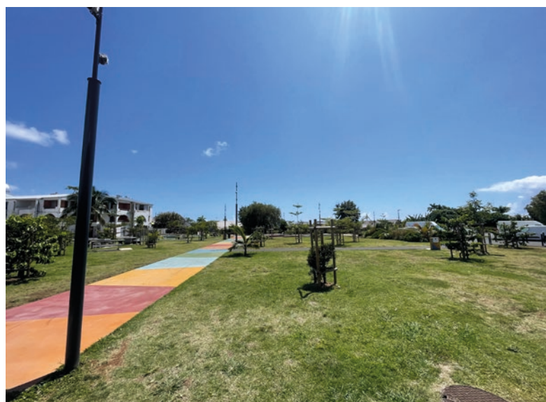
Opération « Square Victoria » est financée avec le concours de l'Etat et à l'aide du Fonds Européen de Développement Régional (FEDER). L'Europe s'engage à La Réunion.