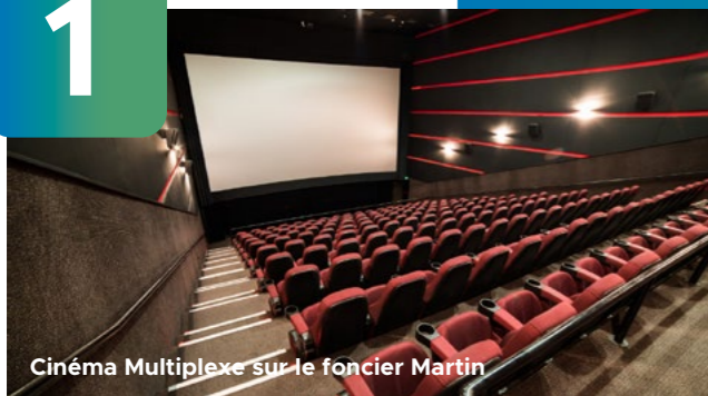
Cinéma Multiplexe sur le foncier Martin