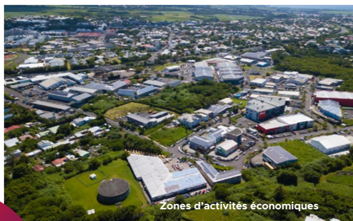
Zones d'activités économiques